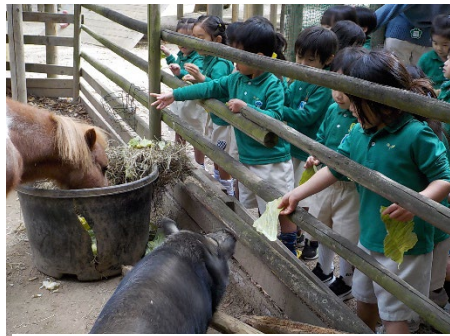
ミニ牧場はいつも子どもたちが集まって、動物たちと日常的に触れあっています！