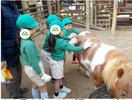
お当番でボーイをブラッシング！