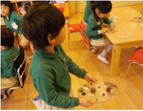
年少組（3歳児）。どんぐりや木の枝でボーイの顔を表現！