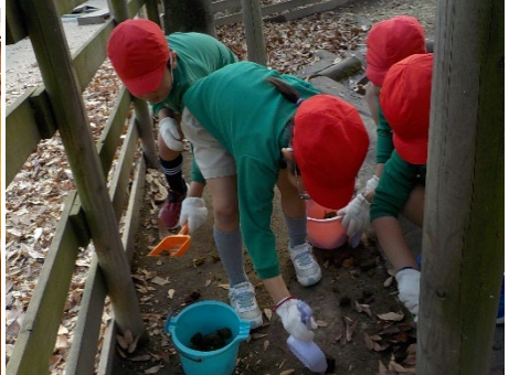
ミニ牧場はお掃除もみんなですます！