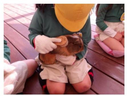
モカ（モルモット）のブラッシング！