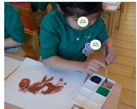
ボーイをまじかで見つ、自分が興味を持ったところ画用紙に描いています！