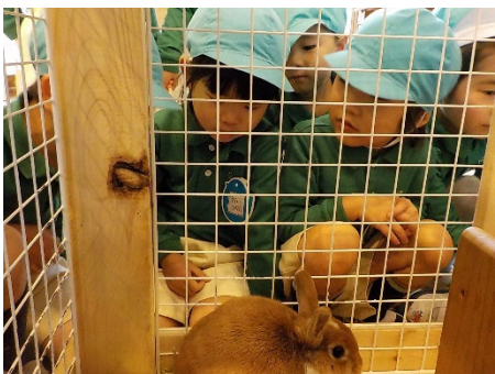
新しく仲間に加わったイブ（ウサギ）と初対面！